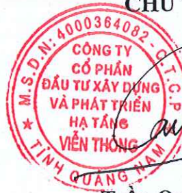
Trần Quốc Trân